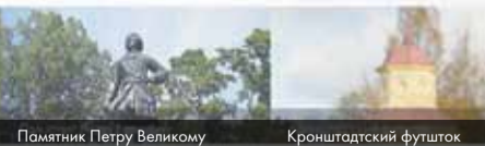
Памятник Петру Великому

Муниципальное Образование город Кронштадт